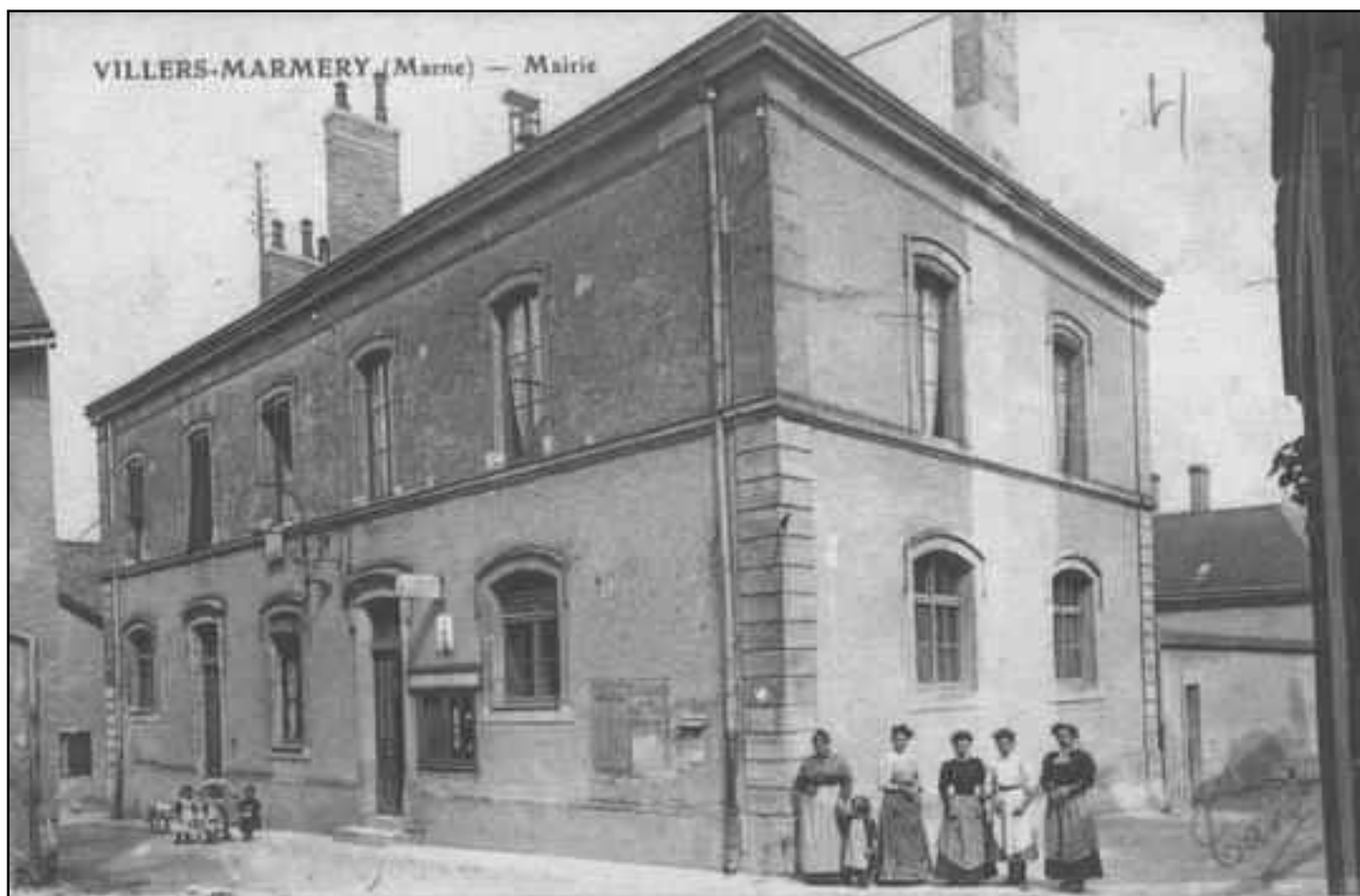
IMAGE DU PASSÉ...