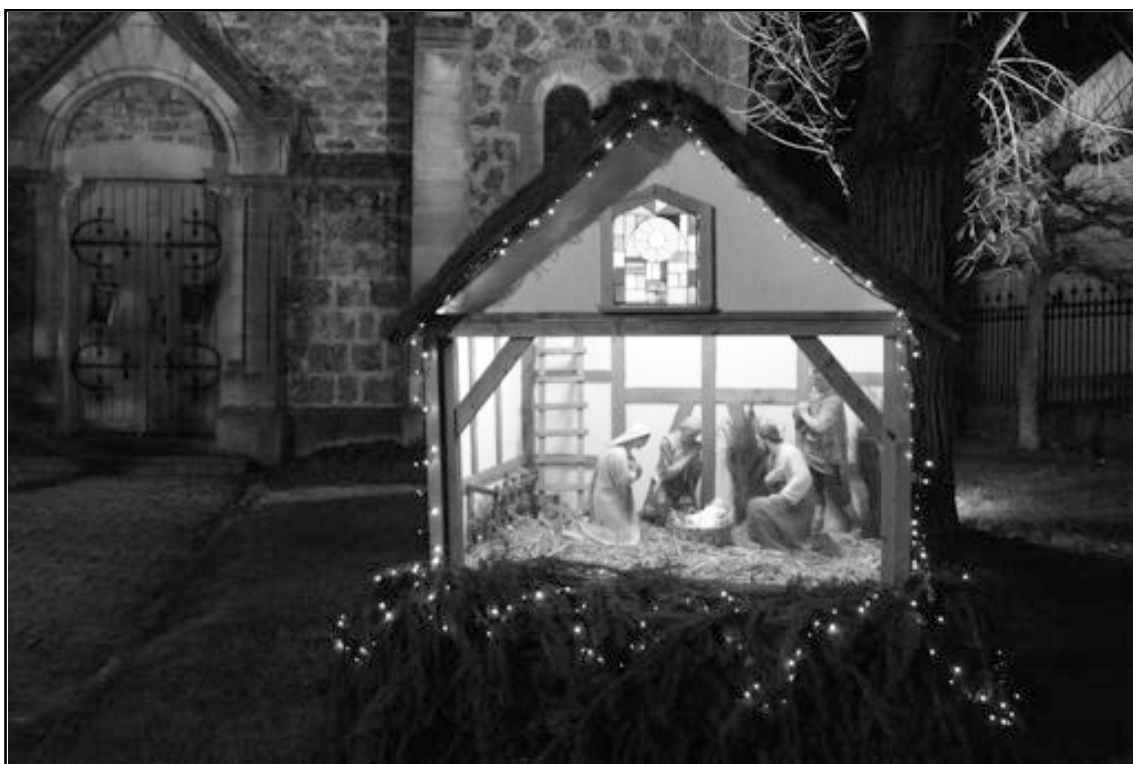
Cette année encore, la Commission des Fêtes organise un concours de crèches. Joyeux Noël à tous.