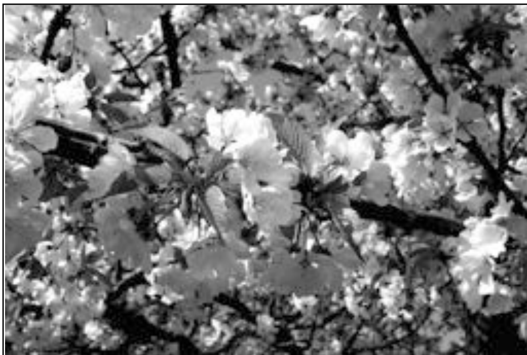
Joli mois d'avril...