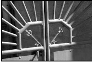
PHOTO MYSTÈRE N°15

La réponse à notre précédente photo-mystère était : Porte en fer, au 7 rue Pasteur.