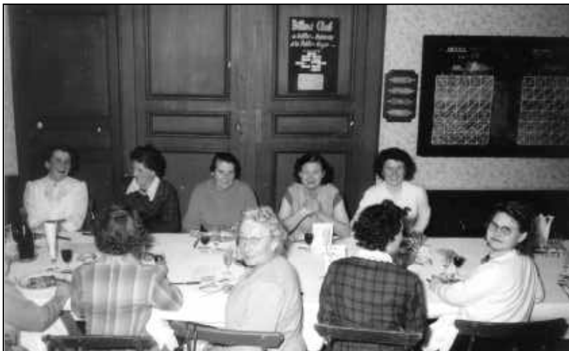
Cette photo paraîtra dans la brochure "Mémoire d'un siècle"...