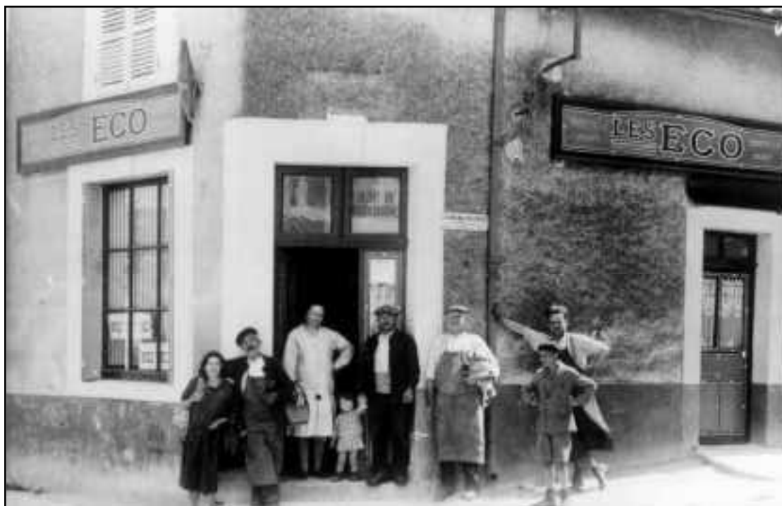
Cette photographie fait partie des images sélectionnées pour figurer dans la brochure "Mémoire d'un siècle"...