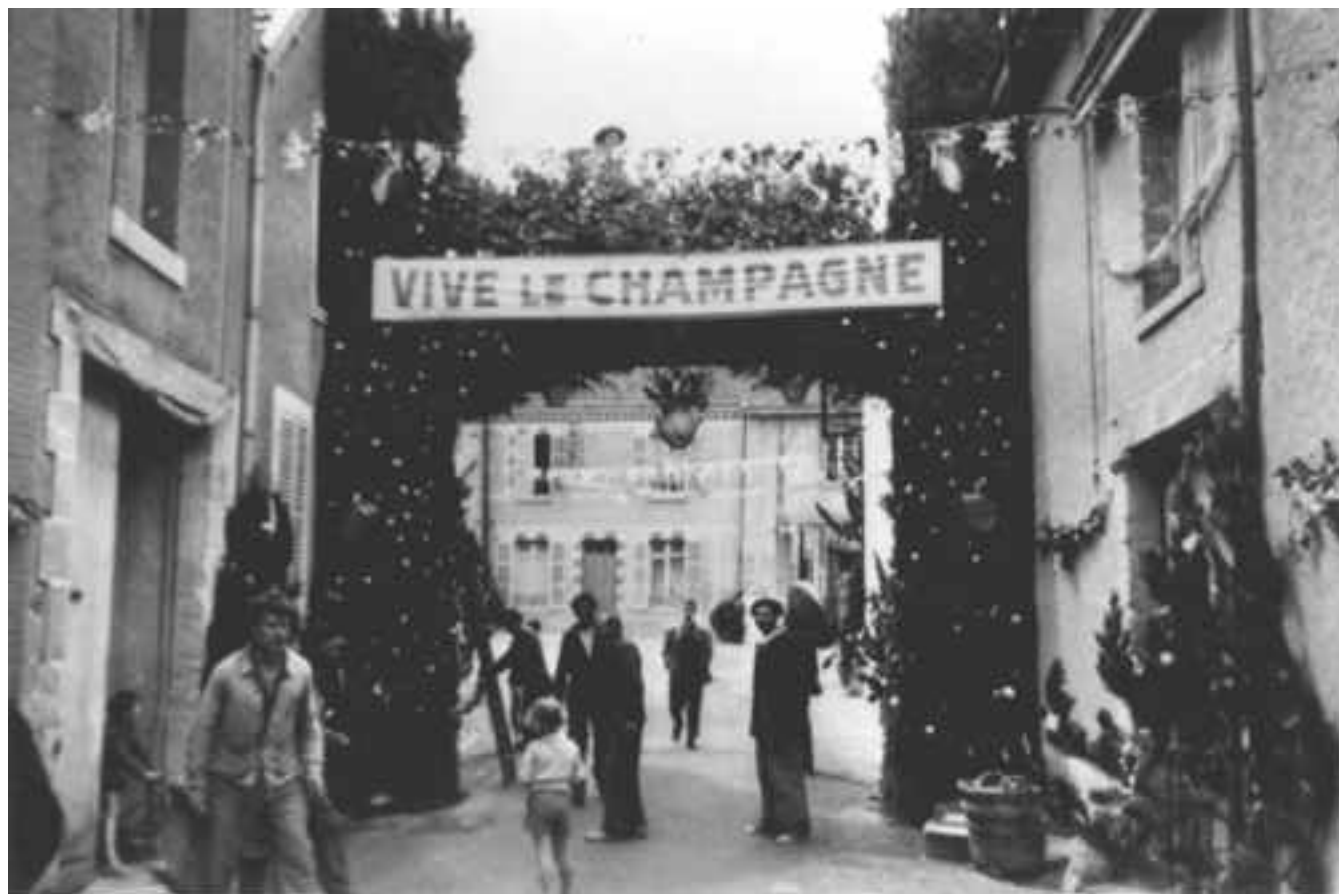
IMAGE DU PASSÉ...

Si vous pensez reconnaître une personne sur cette image, contactez-nous. Merci