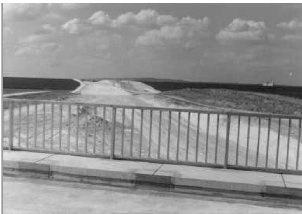
Eh non ! Il ne s'agit pas des travaux du futur TGV, mais de la construction de l'autoroute A4