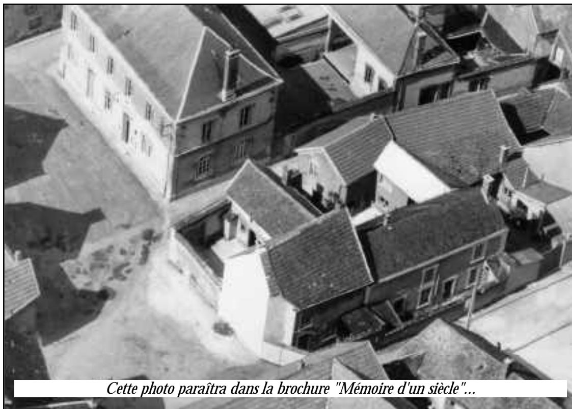
Cette photo paraîtra dans la brochure "Mémoire d'un siècle"...