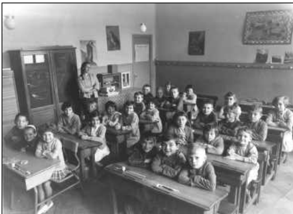
Cette photo paraîtra dans la brochure "Mémoire d'un siècle"... prévue courant 2002