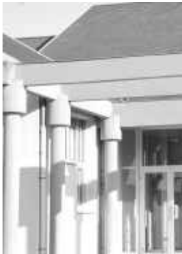
PHOTO QUIZ N°3

La réponse à notre précédente photo-quiz était "La salle polyvalente".