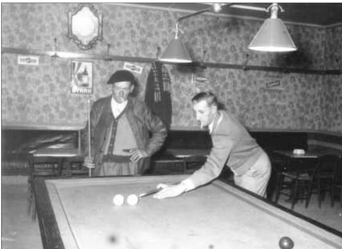
Cette photo paraîtra dans la brochure "Mémoire d'un siècle"... prévue courant 2002 - Merci à Mme Josiane DAIRE