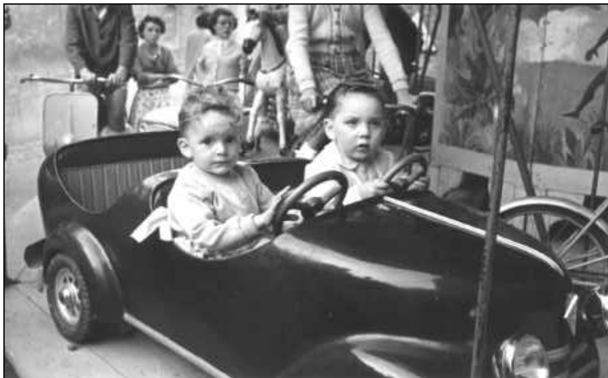
Cette image sera dans la brochure "Mémoire d'un siècle à Villers Marmery". Nous recherchons toujours des photos des vieux métiers et des commerces ainsi que du moulin et du C.B.R...