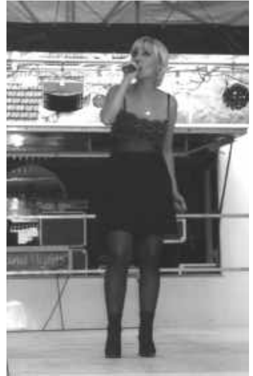
Souvenirs de la Fête patronale 2000...