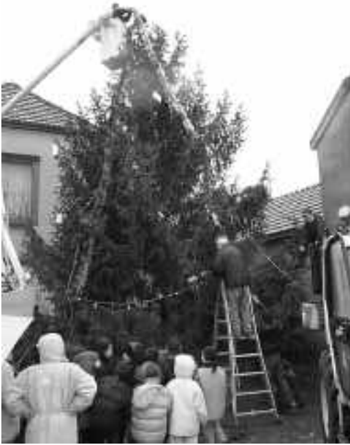
Bonnes fêtes de fin de siècle à toutes et à tous...