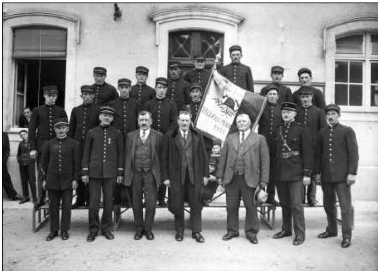
Cette image sera dans la brochure "Mémoire d'un siècle à Villers Marmery". Pensez à regarder dans vos collections personnelles pour la prochaine collecte...